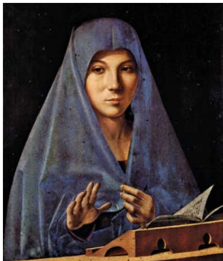
Antonello da Messina „Zvestovanie Panne“

Ak chcete mať túto scénu presne pred očami, skúste sa prizrieť jednej olejomalbe, ktorú ešte v druhej polovici 15. storočia vyhotovil sicílsky maliar Antonello da Messina. Názov tohto obrazu by sme mohli preložiť ako Zvestovanie Panne. Na tomto obraze sú pozoruhodné tri detaily. Prvým je otvorená kniha Svätého písma. Presný text, ktorý Panna číta, nevidíme, ale za to si môžeme všimnúť ozdobnú iniciálku, ktorá nám jasne ukazuje, že sa jedná o úplný počiatok kapitoly, či dokonca celej knihy. Druhým detailom je pohľad mladej dievčiny. Tá si už od prvých chvíľ ukladá každé slovo do svojho naskrz čistého srdca a vo svojej myslí nad